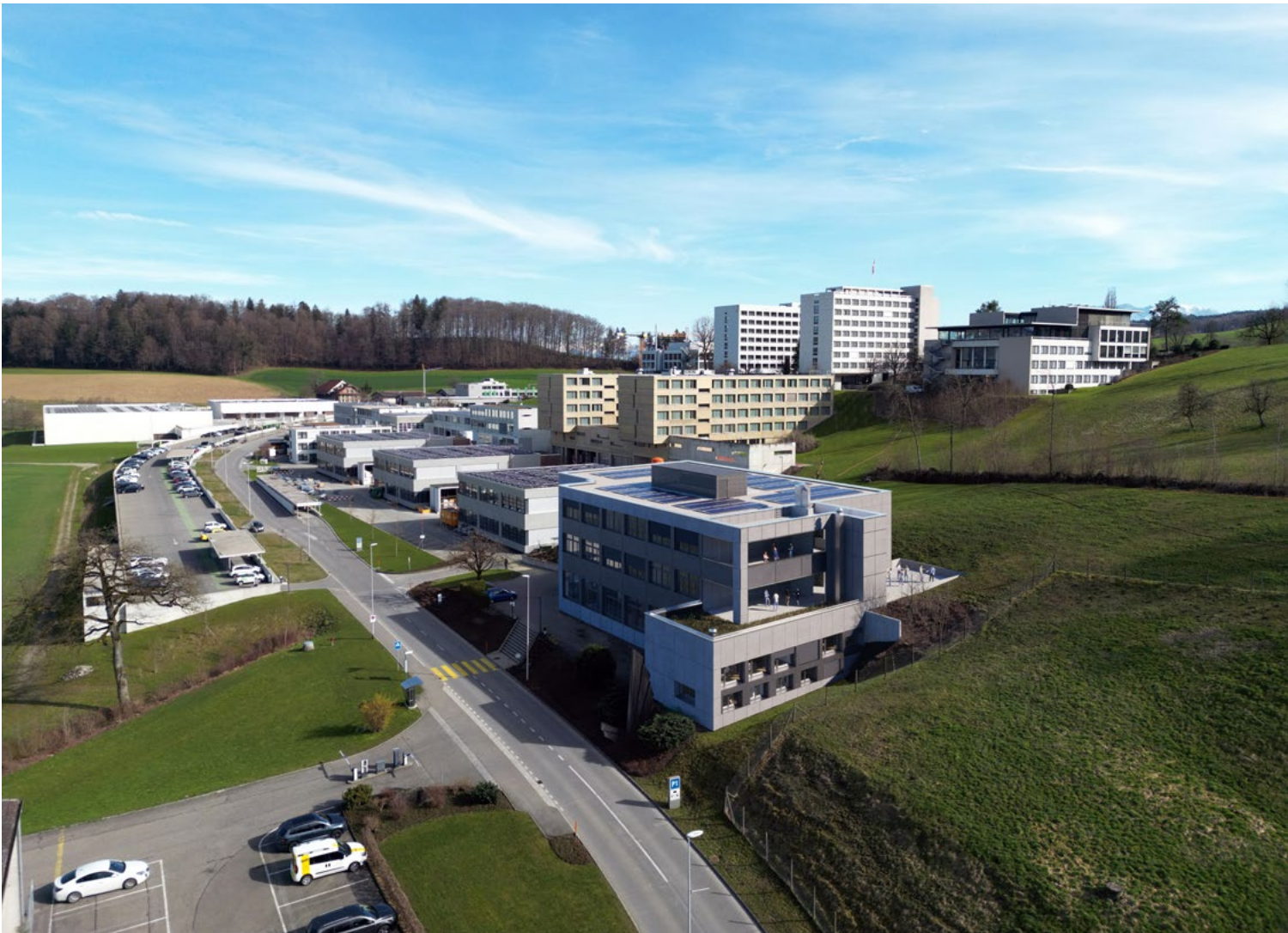
Visualisierung des Campus Sursee, des grössten Bauausbildungszentrums der Schweiz, mit dem künftigen Gebäude «AllianzOne».

Das Pionierprojekt AllianzOne am Campus Sursee zeigt allen Allianzpartnern die Knacknüsse auf diesem Weg zum Ziel. Das Bauausbildungszentrum will aus den gemeinsamen Erfahrungen lernen, um auch diese Kompetenzen künftig vermitteln zu können.