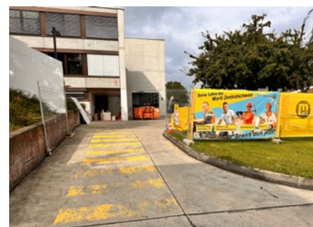
Baustellenabschrankung auf dem Campus Sursee.

«Das Optimierungspotenzial beim Einbezug der Unternehmer ist beträchtlich. Da sind wir gerne dabei.»