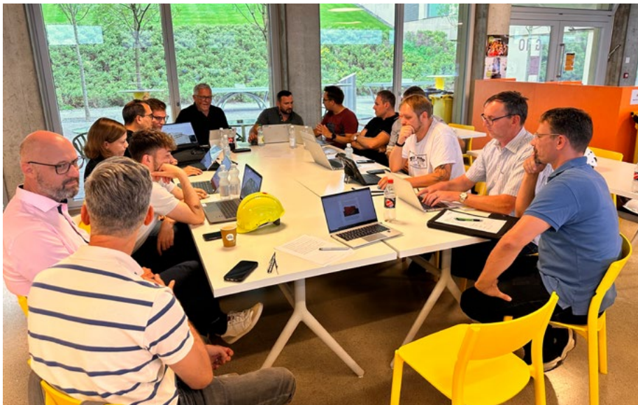
Das Allianzteam hat nach der langen, intensiven Vorbereitungszeit einen gemeinsamen Spirit entwickelt.

«Unsere Unternehmenskultur ist prädestiniert für den partnerschaftlichen Umgang in einer Allianz.»