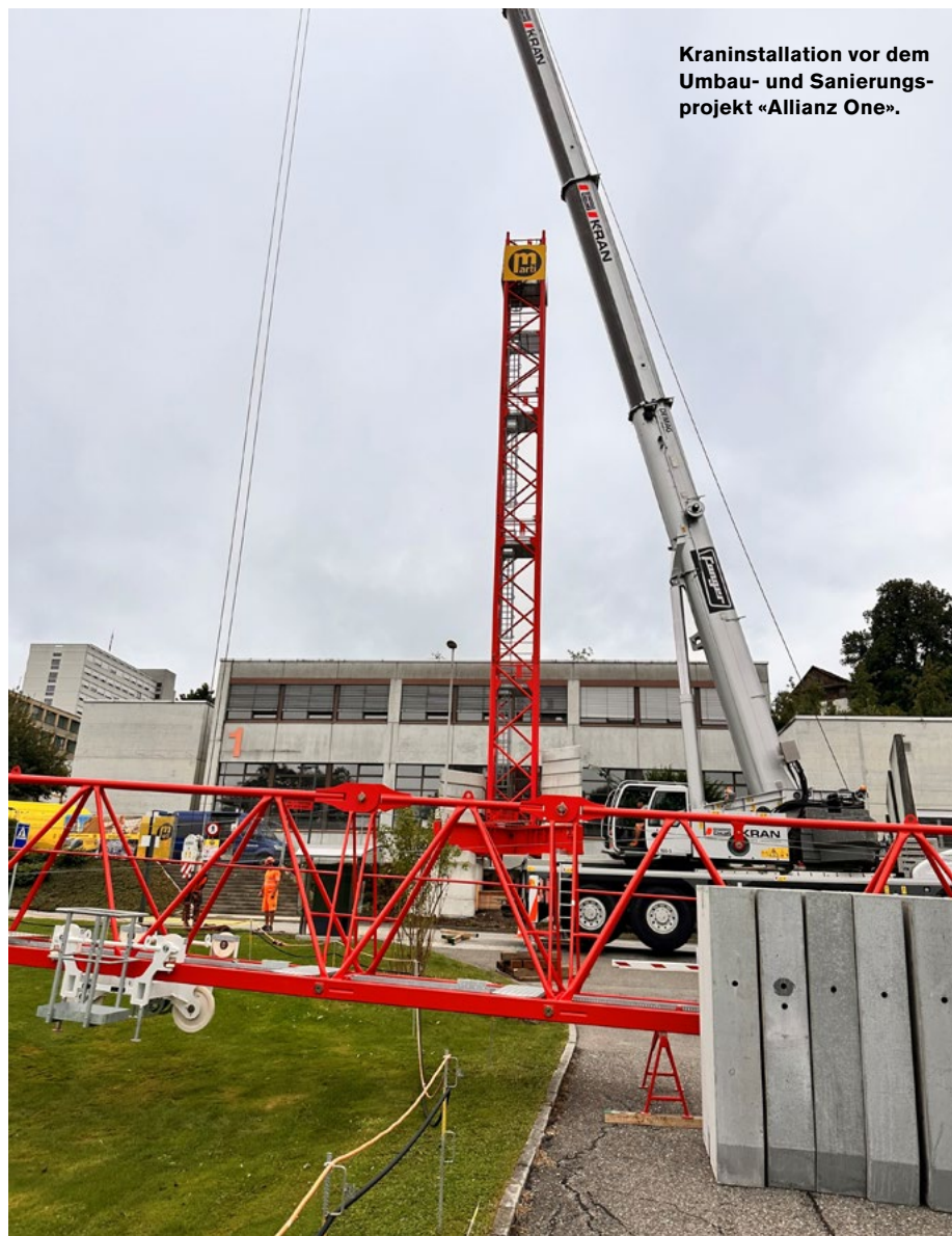
Kraninstallation vor dem Umbau- und Sanierungsprojekt «Allianz One».